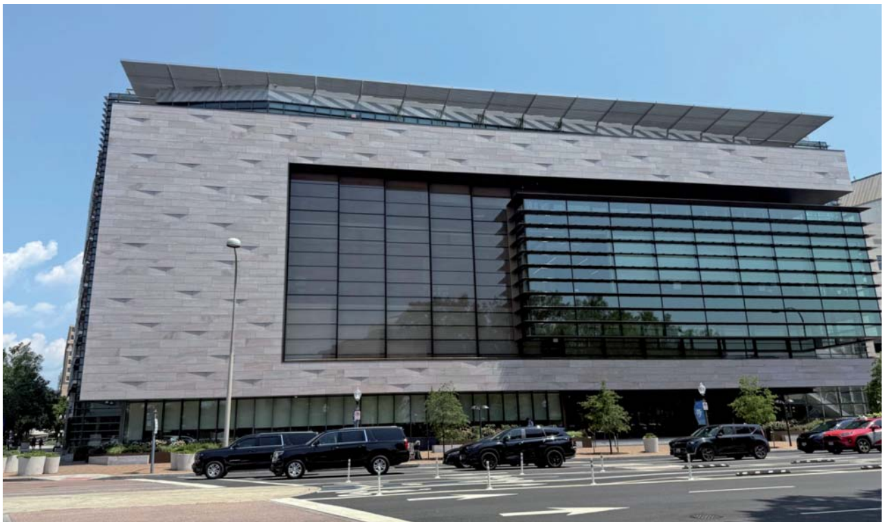
Abb. 2: Veranstaltungsort war das relativ neu erbaute Bloomberg Center der Johns-Hopkins-Universität Washington

Im Gegensatz zur DGfMM beschäftigt sich die Performing Arts Medicine Association PAMA nicht primär exklusiv mit Musikerinnen und Musikern, sondern gleichermaßen auch mit der Tanzmedizin, aber auch mit medizinischen Problemen von Artistinnen und Artisten, Zirkuspersonal, wie auch Schauspielerinnen und Schauspielern. Die